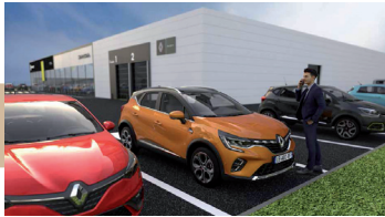
Demande de rénovation