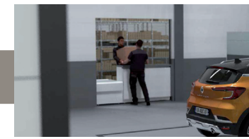
Commande pièces de rechange