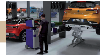
Chiffrage des réparations