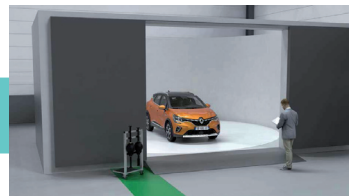
Photo / Digitalisation