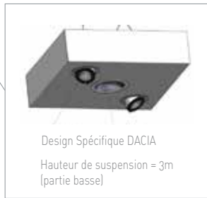
Exposition 6 véhicules