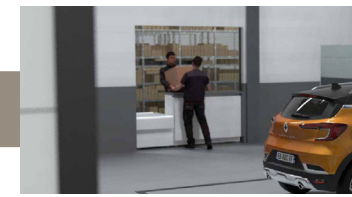
Commande pièces de rechange