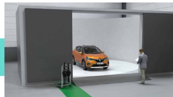
Photo / Digitalisation