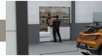
Spare parts order