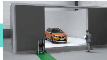
Photo / Digitalization