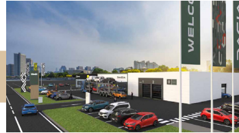
Collection of the vehicle from the customer