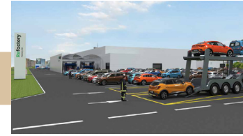
Reception at the Renew Factory