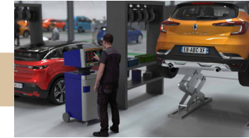
Costing of repairs