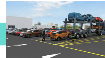
Return to the customer